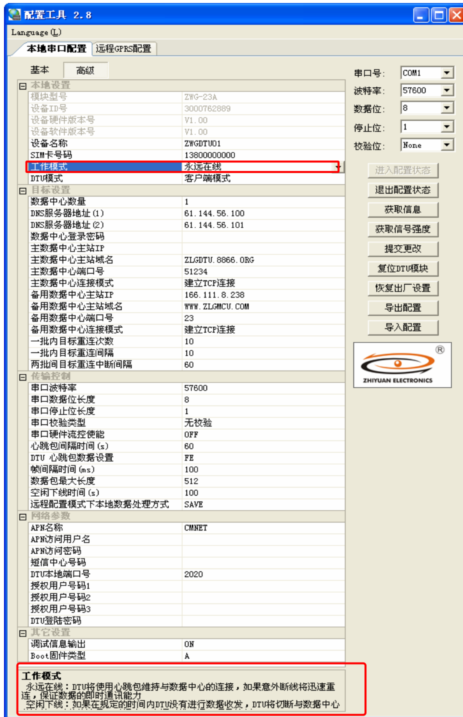
图 6 配置工具界面