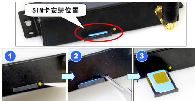
图 2 SIM 卡的安装

SIM 卡的安装如图 2 所示。设备对于 SIM 卡的要求： 1: 不欠费 ， 2: 开通 GPRS (CMNET 业务) ，如没开通，请与当地移动运营商联系。