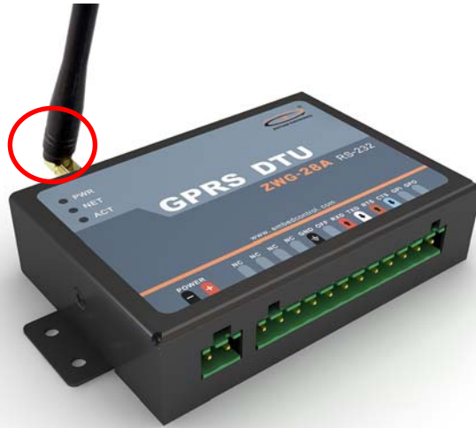
图 1 天线检查

打开设备包装盒，首先检查设备的天线安装是否松动，如果松动，请旋紧，如图 1 所示。如果使用与设备不匹配的天线，将会造成设备的工作性能改变（信号衰减、注册网络失败、功耗增加、设备重启等等），因此请勿随意更换设备天线。