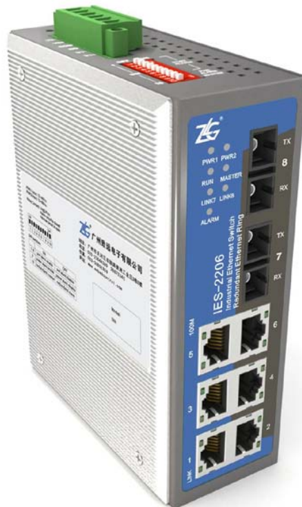
图 3.1 IES-2206 产品示意图