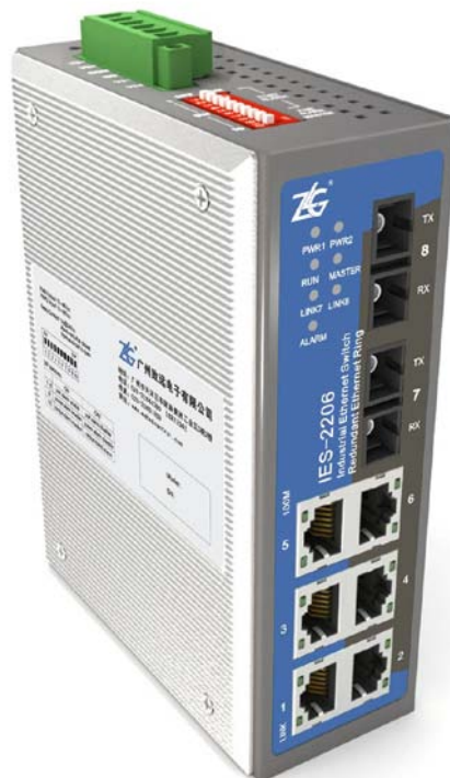
图 3.1 IES 系列交换机产品示意图